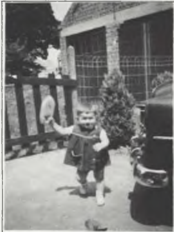
Welke kwatong zei daar dat onze Publius zich niet bekend durft te maken? Hier heb je 'm, onze jonge RVB-correspondent, speelt en monter zoals altijd! (N.B. de foto is de meest recente uit het B.O.B.-archief)

had de uitslag van deze stemming er gans anders kunnen uitzien. Overigens waren er van de acht studentenafgevaardigden ook maar drie aanwezig... Hiermee heeft de RVB een knap staaltje weggegeven van enkele van haar slepende ziektes : absentisme en politiek gekonkeloef.