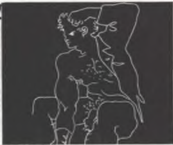
Le sang d'un poete. Jean Cocteau, Fra, 1951, 51 min., nederl. ondert.

'Le sang d'un poète' veronderstelt een enorme openheid van de kijker, want hij moet de weerstand tegen een eigenzinnige vertelstijl overwinnen. De droomassociaties zijn zo persoonlijk, de beelden zo gelijkwaardig, dat het moeilijk wordt om zich betrokken te voelen en zijn emoties de vrije gang te laten gaan. De film is niet surrealistisch, het bewustzijn wordt nooit uitgeschakeld. In een van zijn erg genietbare artikels in 'Le Figaro' schrijft Cocteau: "Een wit blad verlamt je. Begin dus maar met om het even wat. Schrijf op: "Op een lange winteravond...", en ga verder; een zin in de aard van de zin die mijn eerste film opent: "Hoewel in de verte de kanonnen van Fontenoy bulderden...", en zin die de Freud-discipelen kapotzochten naar de verborgen betekenissen, maar die in feite niets anders betekent dan het kortaaf ontvangen van een werk" (11 mei '53). "Le sang d'un poète" is een film die blijft intrigeren en daaraan zijn plaats in de filmgeschiedenis heeft te danken.