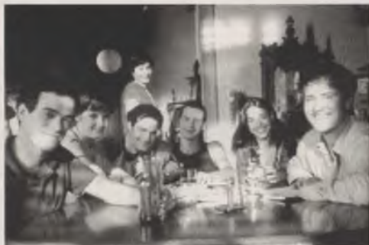
"L'AUBERGE ESPAGNOL, FILM OVER DE ERASMUSERVARING VAN STUDENTEN"