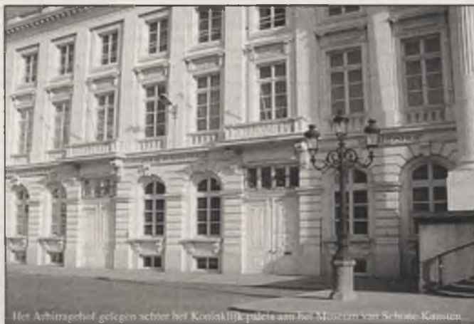
Het Arbitragehof gelegen achter het Koninklijk paleis aan het Museum van Schone Kunsten

De eigenlijke – door de EU-Commissie openlijk uitgesproken – bedoeling is de schepping van een eengemaakte Europese Hoger Onderwijsmarkt, daar waar onderwijs in de lidstaten tot nu toe een in functie van het algemeen belang van overheidswege gereglementeerde aangelegenheid is. Het Vlaams Parlement keurde desalniettemin slaafs het Bologna-structuurdecreet goed, de