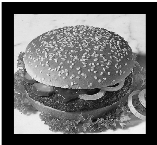
"Hoe voeden wij de status quo ... ?"