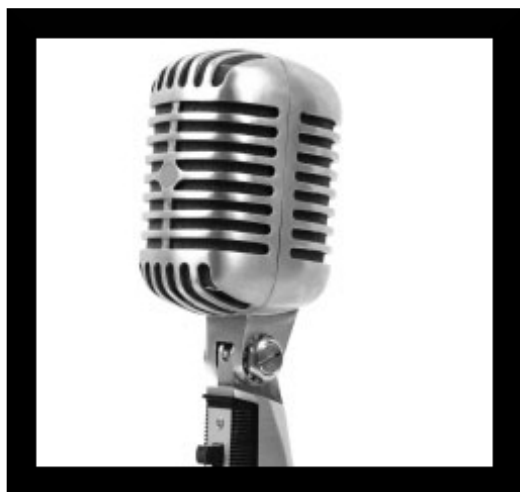
"Brussel zonder stem ... ?"