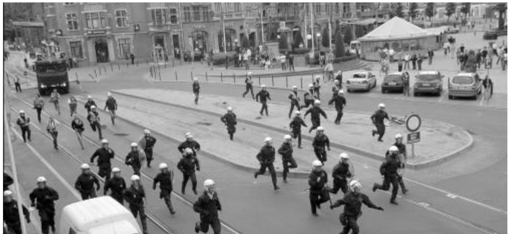
"Liefde voor Brussel is vooral liefde voor het Vossenplein."