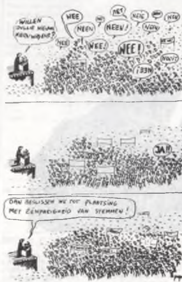
Uit de Groenen

van de vredesbeweging heeft te maken met een overschatting van de werking en het democratisch potentieel van het politieke bedrijf. Vermeedelijk was voor veel mensen de deelname aan een anti-rakettenbetoging