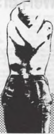
V.U.: PETER DE KONING

p.a.: GEBOUW Y' PLEINLAAN 2, 1050 BRUSSEL