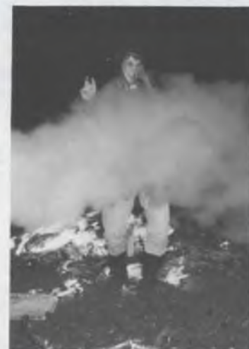
Blusapparaat bracht redding.