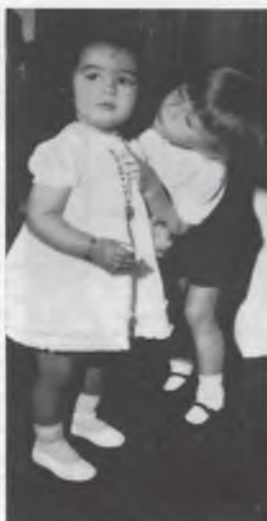
In welke richting zit jij ?