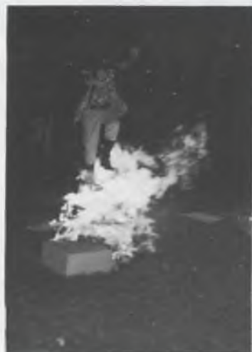
Student E.W. in volle aktie.