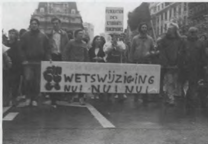
De kop van de betoging.

Gent, Brussel, Namen, Luik en Louvain-La-Neuve. Een rustig sfeertje kenmerkte het hele gebeuren. Er werden wat sloegans geskandeerd ("Vrijstellingen Ja, Rechtszekerheid Nul", "Les ministres au Zoo, Libérez les animaux" en "Hop hop hop, Coens aan den dop!"), een trompetspeler fleurde de zaak op met enkele oldies ("When the Saints go marching in") en voor de rest spandoeken, borden en wat handgeklap. Nu ja, de glotende regen en de ijzige wind waren niet direkt een stimu-