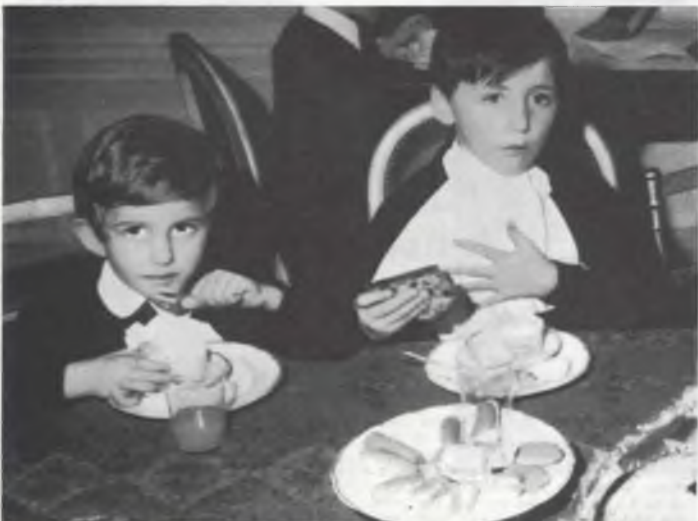
Wat later op de avond konden de beentjes weer eens onder de tafel gestoken worden!