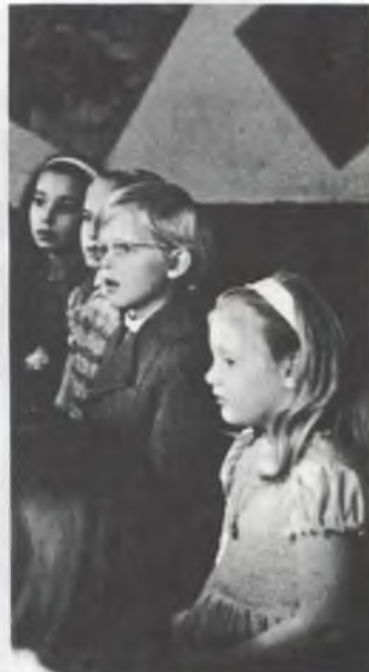
...aandachtig wordt er toegehoord