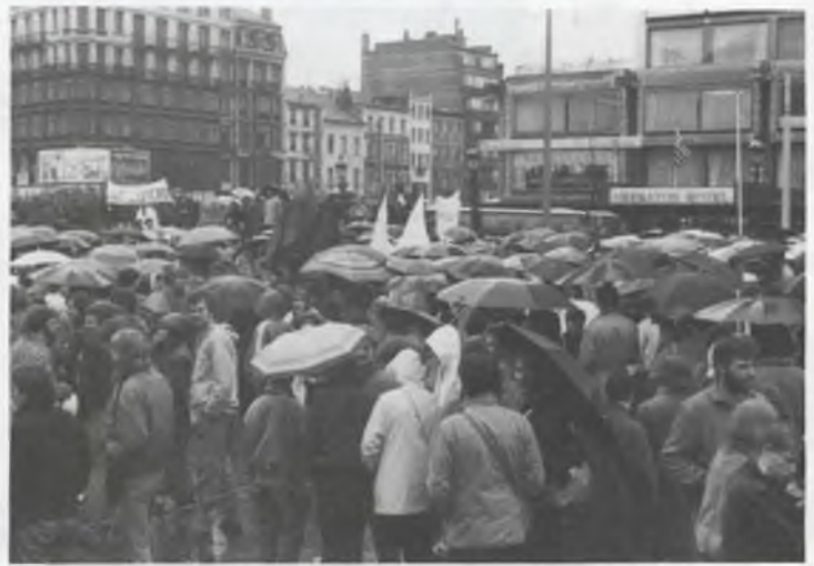
De massa kwam samen op het Rogierplein.