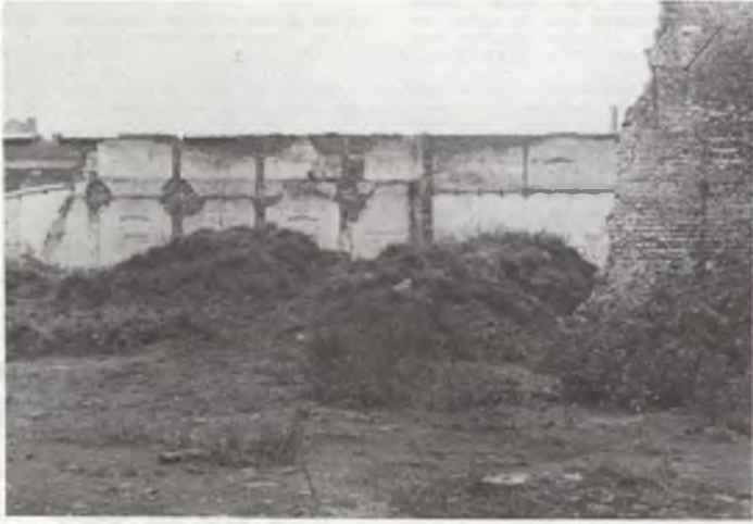
Hier komt het zwembad.

De bouw van het VUB-zwembad, gepland aan de Triomfplaan, kan bijna aanvangen. De bouwplannen zijn voltooid, ingediend en goedgekeurd. De noodzakelijke gelden zijn toegekend. Alleen de formele bouwvergunning van de gemeente Oudergem laat op zich wachten. Technisch is alles in orde, maar het zwembad vormt slechts een deel van de ingewikkelde problematiek rond de Koninklijke