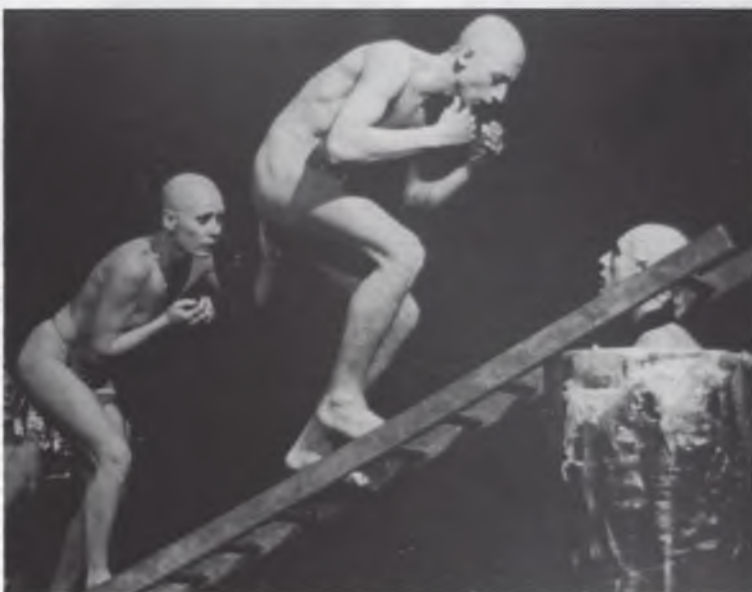
Danspas: blz.4 (foto: 'Zuilenveld' door Piramide op het punt)

De Moeial is niet te stoppen. Zelfs onder het gebonk en geratel van de verbouwingswerken in gebouw Y' haalden we voor julie deze Moeial van onder het stof vandaan. Op zes bladzijden i.p.v. acht ditmaal, begrijpt u.