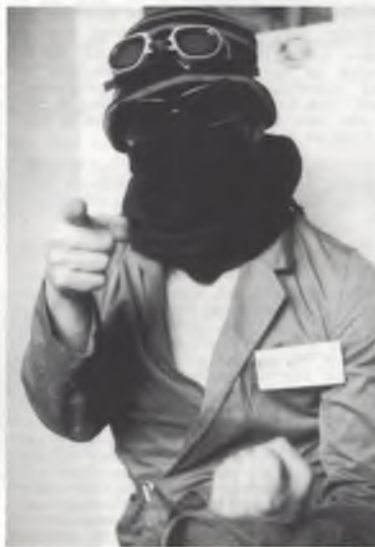
Als ik roep moet iedereen zwijgen.

gevallen. Nu hoor ik persoonlijk tot de strekking binnen de redactie die in de eerste plaats een ruim publiek wil bereiken, ook al moeten we de kwaliteit daarvoor wat terugschroeven. De andere strekking vindt dan weer dat we het huidige niveau hoe dan ook moeten handhaven. Willem: En de bijeenkomst van vanavond had