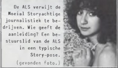
De ALS verwijt de Moelial Storyachtige journalistiek te bedrijven. Wie geeft de aanleiding? Een bestuurslid van de ALS in een typische Story-pose. (gevonden foto.)

Wat de ALS met deficitair werken bedoelen is dat de SoR de 3 miljoen besparingen van de regering terug eist en niet uit eigen zakken wil halen. Het is Inderdaad zo dat de ALS zich vergist heeft over "het op zijn" van het geld tegen eind december. Het tekort zal Inderdaad moeten ingekalkuleerd worden in de begroting van volgend jaar. Maar dat verandert niets aan de tactiek van het deficitair werken! Het standpunt van de SoR, komt er echter op neer dat van de RvB geëist wordt dat voor dit tekort geput wordt uit het patrimonium. Dit betekent, hoe je het ook draaft of keert, een besparing. Het geld voor dit tekort uit de reserves halen betekent dat dit geld niet voor andere doeleinden (b.v. verbetering van de studentenwoningen...) kan gebruikt worden. Daarnaast zullen de reserves op die manier binnen enkele jaren (de besparingswoede van Martens is trouwens pas begonnen!) toch uitgeput moeten raken. De SoR beweert dat op deze manier de studenten en het personeel kunnen gespaard worden. Dat is misschien zo zolang er uit de reserves kan geput worden, maar hoe lang zal dit nog het geval zijn? De ALS stelt dan ook dat deze manier van werken alleen maar uitstel van executie kan betekenen.