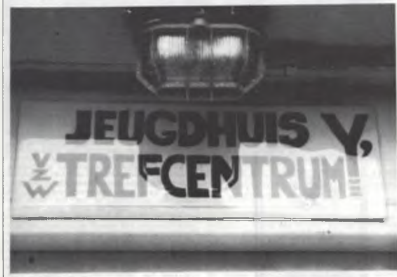
Een kaffee wordt geen jeugdhuis door er een bordje op te hangen.

Op woensdag 9 juli organiseert het BSG opnieuw een openlucht-eindejaarsfeest. Gewoontegetrouw (tenzij de weergoden ons niet gunstig gezind zouden zijn) gaat die ook dit jaar door op de esplanade vóór de gebouwen B en C. Reserveer alvast deze datum in je agenda, vertrek een dag later op vakantie of vervroeg je laatste examen zo je dat nog zou moeten doen; als er één td is die je niet mag missen is het deze wel!