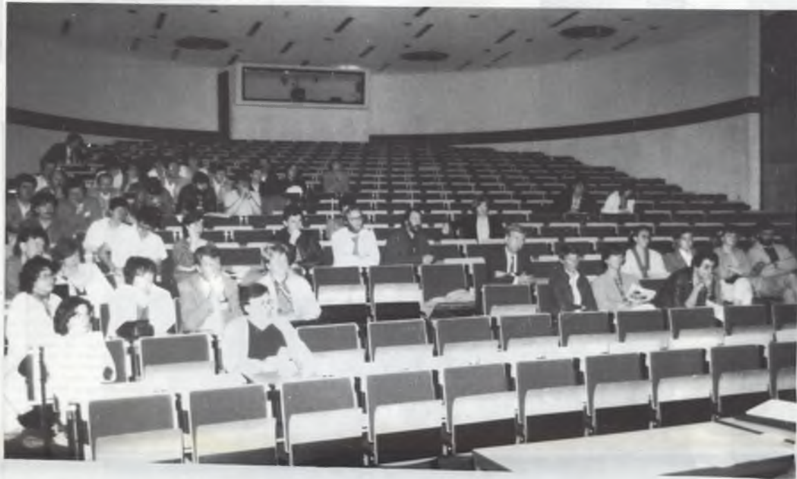
DE PERSONEELSVERGADERING: DE LINKERZIJDE HAD EEN DUIDELIJK OVERWICHT. ZESTIG AANWEZIGEN, IETS MEER HAD TOCH WEL GEMOGEN.