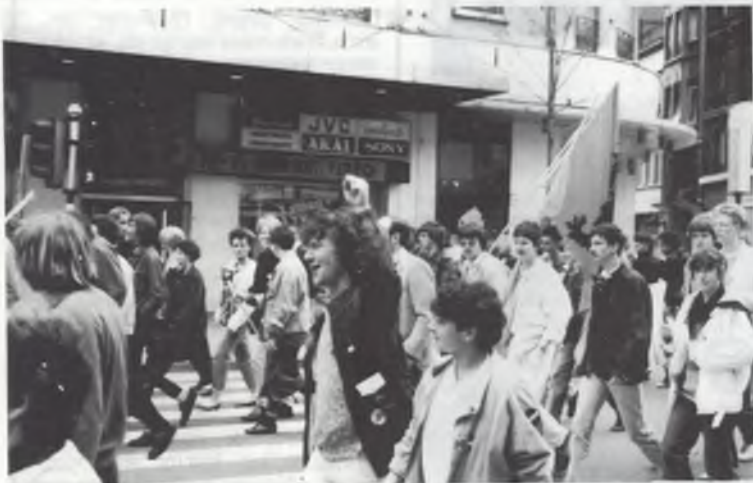
SOR.-LID EN EX-VOORZITTER VAN DE A.L.S. ONDER DE VLAAMSE LEEUW. ZIJN VLAAMS-NATIONALE SYMPATHIEEN KON HIJ VROEGER OOK AL NIET ONDER BEDWANG HOUDEN.

Samen met de staking van de openbare diensten op 6 mei vond er in Brussel een nationale scholierenbetoging plaats. Een kleine duizend deelnemers uit de beide landsdelen. Onder het motto 'arbeiders-studenten: één strijd' deden ook heel wat personeelsleden van de Brusselse agglomeratie mee. Het waren vooral zij die de betoging een beetje indrukwekkend maakten met hun vloot vuilniswagens en straatvegers. Het aantal V.U.B.-