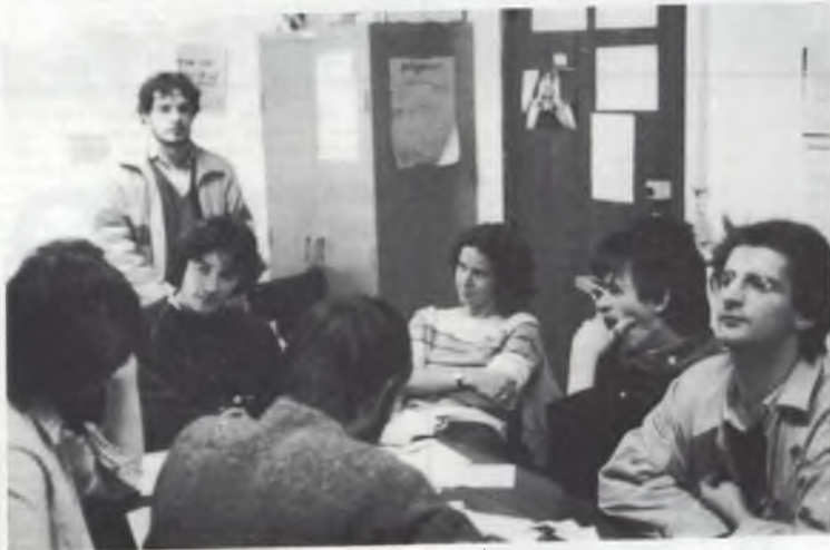
Sociale Lijst en ALS-kandidaat en toeschouwers.