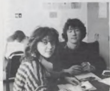
ALS kandidaat en MLB kandidate

Van De Velde: Ik wil beginnen met een kleine anekdote. Toen onlangs de prijs van een sportkaart met 50 fr. omhoog ging hebben de Aktief Linkse Studenten in het restaurant een pamflet uitgedeeld om daar tegen te protesteren. Ik vond dat een heel goed initia-