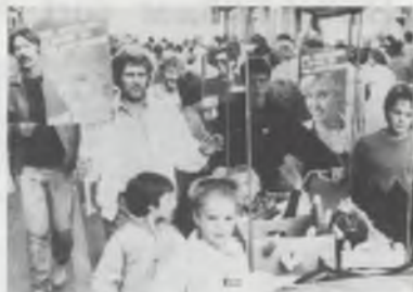
Snel masturberen zo dom als...

Tenslotte (20 oktober) ging in Brussel ook de rakettenbetoging door. Met delegatie van de Moelial, of wat had U gedacht, wij zijn echt niet stom hoor. Wij waren erbij, een klein groepje van de 250000 die toch niet opgaven, misschien wat nalef verder bleven hopen op wat democratie. De raketten moeten buiten!