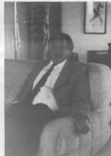
DE RECTOR OOK