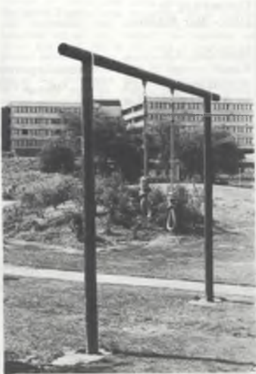
September, derde zit, de galg?