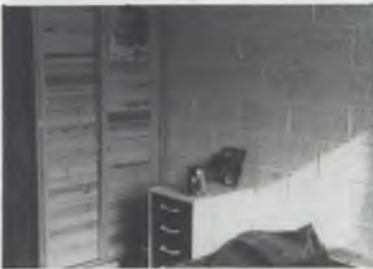
Maison 1043, Monkey-business

Een duister zaakje dachten wij hier op de Moelial en staken onze neus en nog veel meer in het gebouw. Bleek dat het hele geval van het OSB en de rektor was en in beheer (voor een deel?) van 'Huisvesting'. Schone, ruime koten, een propere keuken, dit moeten inderdaad de "uitstralingskoten" van de VUB zijn. Ondertussen hebben zij ook een bewonerskommissie en een fuif op 15 januari in het Kulturkafec.