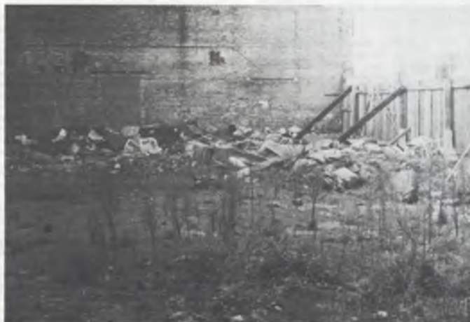
DE MOEIAL WENST AL ZIJN LEZERS EEN