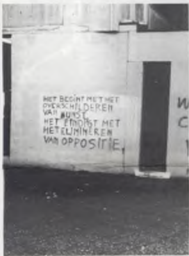
Zelfs de doorwinterde VUB-poetsdienter vermag niets tegen de hardnekkigheid van lokale graffiti.

1986, weer een jaar dat zijn aanvang kent. Verschillende media hebben u al een overzicht gegeven van het voorbije jaar. Nog niet genoeg gehulverd van de bomaanslagen, milleurampen, sterfgevallen van idolen, betogingen die ogenschijnlijk geen zin hadden, uitgehongerde derde wereldkinderen die hun laatste adem op het scherm uitbliezen, vergeten popzangers die hun blaazen oppoetsen ten voordele van deze stakkers en ook ten voordele van hun populariteit, hitjes die deze miserie bezongen door steenrijke sterren die iedereen smeken om een paar centen te geven en ga zo maar door. We oordeelden dat er toch verschillende details te veel uit het oog verloren zijn en meenden eveneens dat de soep een beetje meer peper kan verdragen, van daar uitgaande hebben we het oude archief nog eens opengebrooken en tussen de stoffige papieren van het het voorbije jaar een kleurig overzicht gezift van de gebeurtenissen die ons nauw aan het hart lagen het voorbije jaar. Nostalgie, historici op kleine schaal, vergenoegt of ergert u, aarzelt niet en sla om naar de pagina's 4 en 5.