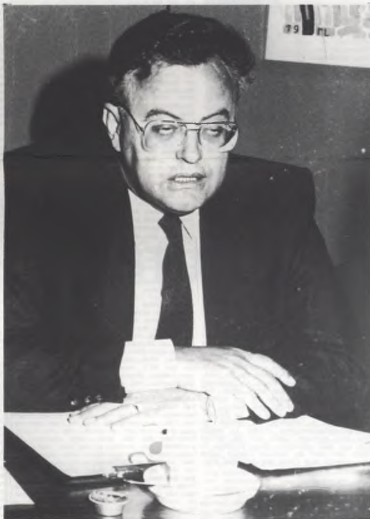
Als Coens de passie preekt, VUB let dan op uw centen

plan: 3 miljoen (indexering toelage 1986) + 11,1 miljoen (vanwege hogere subsidieringscijf 1986/kaap van de 6000 studenten overschreden) + 6 miljoen (indexering toelage 1987) + 11,1 miljoen (subsidieringscijf 1987) = 31,2 miljoen waar de Sociale Sector van de VUB normalerlei recht op had maar waar Martens, Gol, Verhofstadt, Coens en Co een stokje voor hebben gestoken. Waar zaten