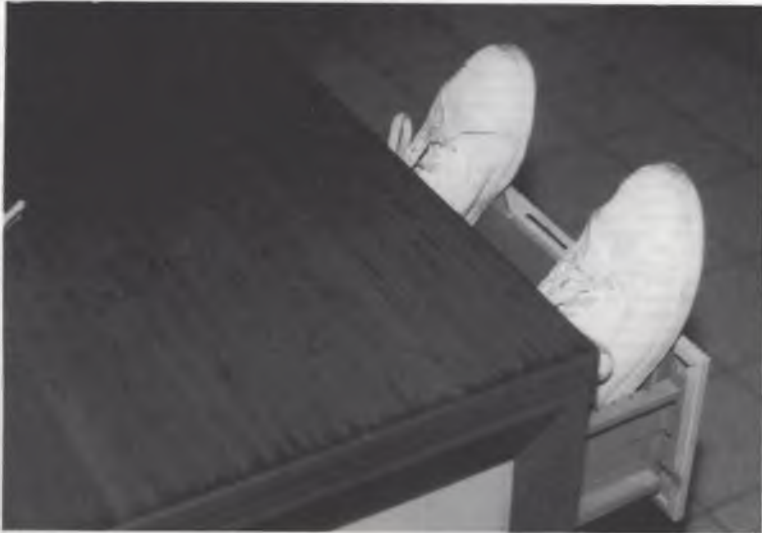
Zo lucht Ludo zijn voeten.

kunt ge al raden : "Piep" hier, "Piep" ginder, "Piep" overal. Dat gepep de hele dag was wel gezellig in het begin, maar op den duur werd ik er gewoon zo van. D'r bleef mij dan geen keus. Ik ben sancties begonnen uit te voeren. Elke muis die twee keer "Piep" durfde te zeggen in een tijdspanne van vijf seconden, ging onverbiddelelijk de vleesmolen in. Zo nog een primitieve, zonder elektriciteit, maar ge zelf moet aan draaien, ge weet wel (voeten bewegen vrolijk heen en weer). Na een week werd "de staat van beleg" verscherpt tot 2 keren "Piep" per minuut, later 2 keren "Piep" om de vijf minuten, en dan per uur en