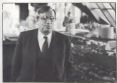
VDV poseerde graag voor onze fotograaf.

gegevens, alle afkomstig uit het JAARVERSLAG 1984 (d.d. 11/06/85) van de Sociale Sector Studenten, dienst Restaurant. Ze hebben betrekking op de activiteiten van het VUB-restaurant tijdens kalenderjaar 1984 -administratieve molens draaien traag, recenter materiaal is niet voorhanden. Administratieve molens draaien niet alleen traag, ze draaien soms duidelijk vierkant- bewust jaarverslag maakt niet meteen een degelijke indruk. Op p.4 serveert de VUB-grill 10 000 biefstukken meer dan op p.5- geen tikfout, want er worden percentages aar staving aangehaald. Eén voorbeeld, er zijn er meer. Ik haal er Pierre Teels-Instrumentaire bij, en hou u in een volgende Moelal op de hoogte.