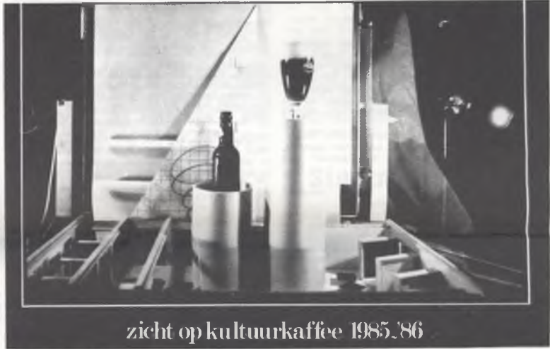
zicht op kulturkaffee 1985-'86

Gallery' V.U.B. (boven Kulturkaffee) Van di.4 februari t.e.m. di.18 februari '86 Elke werkdag van 11 tot 17u Toegang: gratis