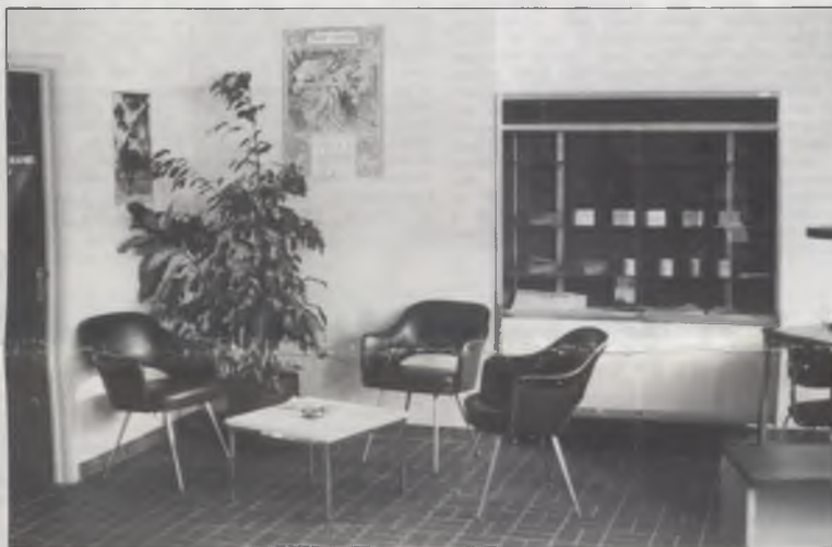
De nieuwe kantoren van de Sociale Sector Jette.