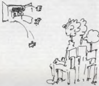
ZE KIJKEN ER GEWOON NAAR DE SPRINGENDE ZEKERINGEN !!

OP DE WAVERSESTEENWEG HEBBEN ZE GEEN KURSIEFJES VAN MOWGLI NODIG OM IN DE STEMMING TE KOMEN