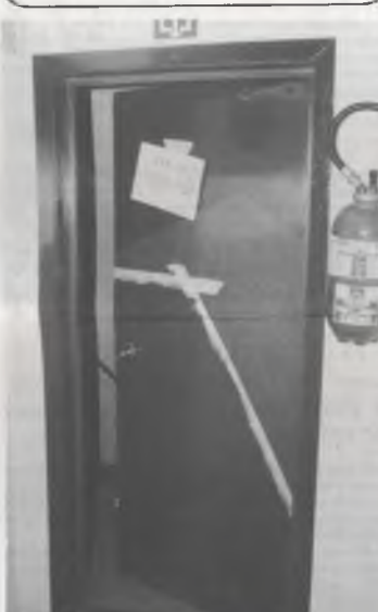
Deze deur werd tweemaal bewerkt door 'vandalen'

(1) Een Bewonerskommissie wordt elk jaar verkozen door al de bewoners van een studentenwijk: elke BWC bestaat uit 12 studenten, waarvan één Voorzitter, één Sekretaris en één penningmeester.