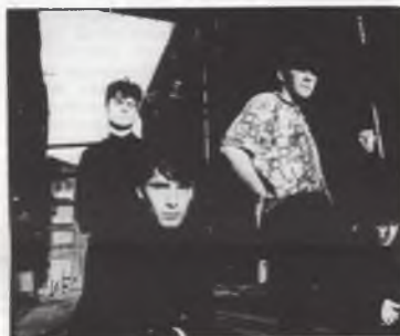
One Thousand Violins

Op woensdag 5 november '86 - 21u Kulturkaffee V.U.B. Toegang gratis