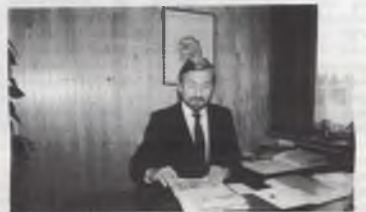
Craeybeckx' kleine oorlog.