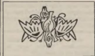
De paradijsvogel, ontwerp van Boon.

Vernissage op di. 13 okt. '87 - 20u - Galery' VUB Inleiding door Ivo Machiels. De tentoonstelling loopt t.e.m. do. 29 okt. '87, elke werkdag van 10 tot 17u. Tegelijkertijd loopt in het VUB-Kultuurkaffee een documentaire fototentoonstelling over leven en werken van L.P. Boon. Toegang gratis.