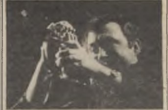
Het Kärtner Jazz Ensemble

Zeven Oostenrijkers in Brussel! Stroomt allen toe. In het kader van het Belg Jazz Festival en Europalia halen we het Kärtner Jazz Ensemble uit zijn isolement. New bop uit de bergen van heren die hun sporen verlienden bij Art Farmer, Slide Hampton, Dexter Gordon, Toots Thielemans en het Vienna Orchestra.