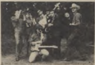
The Samantha Brothers

Zin in een zowel educatieve als ontspannende cursus? Wip dan vanavond eens binnen op de OPEN-DEUR-AVOND in Galery' (boven het Kultuurkaffee) - zo vanaf 19u. Je zal je kunnen informeren over volgende cursussen: keramiek, zeefdruk, zwart-wit fotografie, kleurenfotografie, theater, muziek, modeltekenen en lay-out. De Galery zal trouwens opgevolgd zijn met werken van de senior-cursisten. Visuele boodschappen - maar vanavond komen ook de auditief-aangelegden aan hun trekken. THE SAMANTHA BROTHERS rocken het Kultuurkaffee in vanaf 22u. Ter opwarming: THE NO MORE POSE BAND om 21u. Al deze activiteiten zijn gratis.