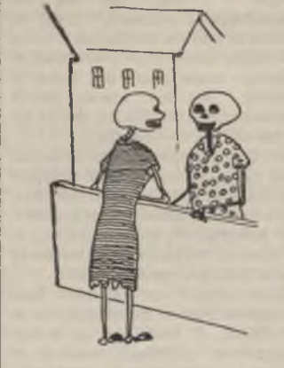
- maar nu moet ik werkelijk weg...