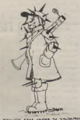
NIEUWSTE RAGE ONDER DE STUDENTEN

Gelukkig kwamen mijn vriendinnen terug en had een groep studenten die voor ons liep (en ook onderhanden genomen waren) alarm geslagen in de studentencafé's. Een meute studenten kwam aangetormd, waardoor de opposanten op de vlucht sloegen. politie, rijkswacht en 100 werden gealarmeerd