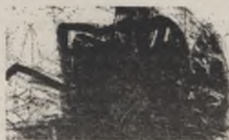
Enk De Kramer

Expo : van 16 december 1991 tot 30 januari 1992 In Gebouw M - 5e verdiep - Pleinlaan 2, 1050 Brussel Open op werkdagen van 9 tot 17 uur.