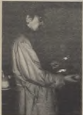
Op deze foto zien we duidelijk hoe een niet-verdachte persoon de door de FBI gesponsordde snassappelen grondig onderzocht.

Onvervalste sensatie in het sensatiekrantje van de V.U.B.. Noem het beest zoals je wil, maar één ding staat vast: liegen doet De Moeial nooit (alé...weinig).