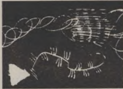
"Beyoncé Daff Care" 1968

"Mc Laren neemt de tekenfilm op daar waar Walt Disney hem heeft gelaten, en brengt hem op het niveau waar Klee de schilderkunst heeft gebracht."