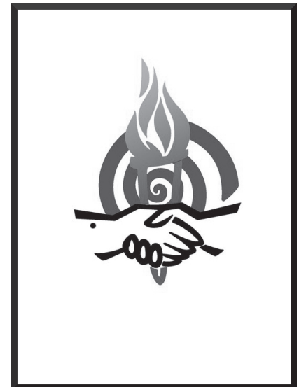
Logo Week van de Verlichting