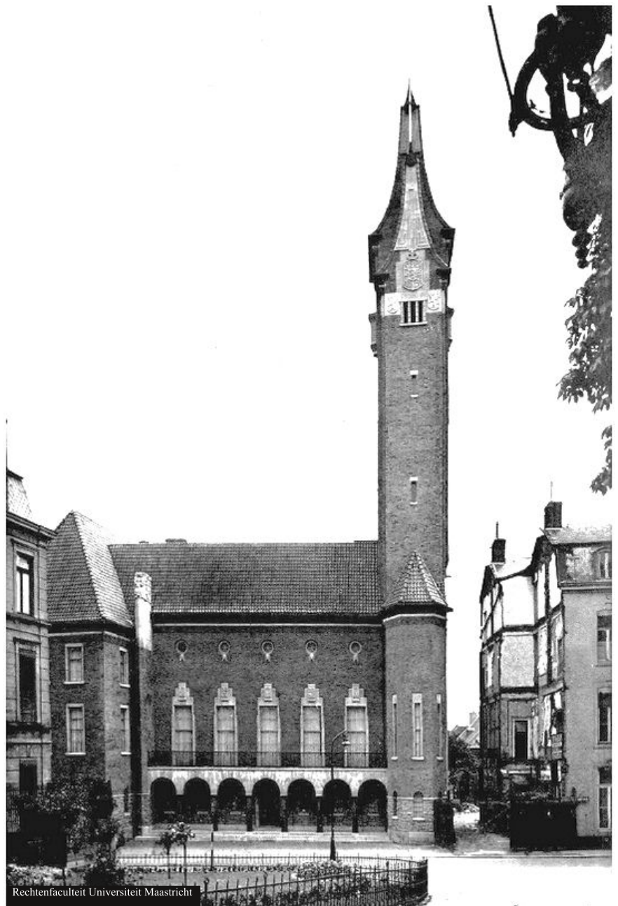
Rechtenfaculteit Universiteit Maastricht

Hoe ziet de toekomst voor landen als Spanje, Italië, Portugal en Griekenland er dan uit? “Misschien zal er, zoals in de Verenigde Staten, mobiliteit in twee richtingen plaatsvinden. Ouderen zouden bijvoorbeeld in Zuid-Europa hun pensioen kunnen doorbrengen en daar beroep kunnen doen op ondersteunende, laaggeschoolde diensten in de zorgsector en horeca. Kijk naar een zonnige staat als Florida. Het jonge talent komt dan weer naar hier voor de kennistechnologie en innovatie. Die jongerenmobiliteit is typisch voor wat ik de Maastricht-generatie noem: jongeren die geboren zijn omstreeks 1992, het jaar van het Ver-