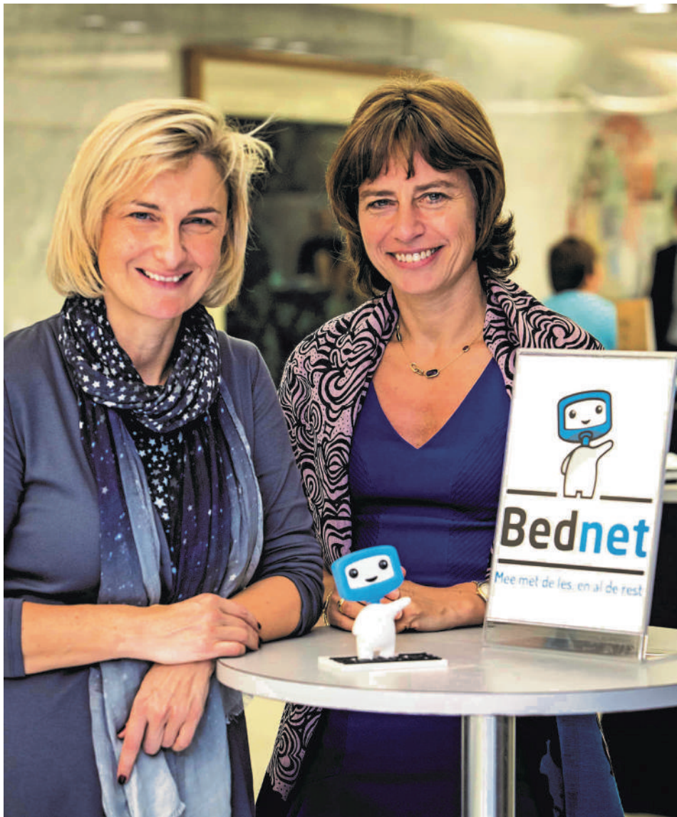
HILDE CREVITS BIJ DE VIERTIENDE VAN 10 JAAR BEDNET, EEN VZW DIE GEHANDICAPTE LEEFLINGEN ONDERSTEUNT.

“Het AMF was een grote hulp, maar we gaan door het wegvallen van dit fonds niet stoppen met onze projecten.”