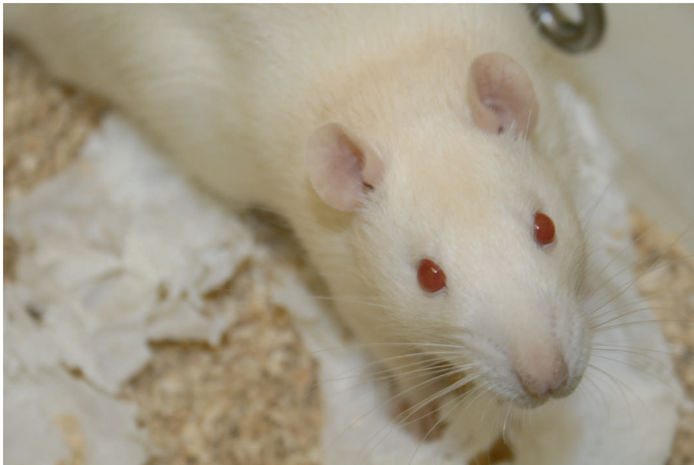
DEZE LABORATORIUMRAT WOONT NIET OP DE VUB, MAAR IN EEN ANDER LABORATORIUM.