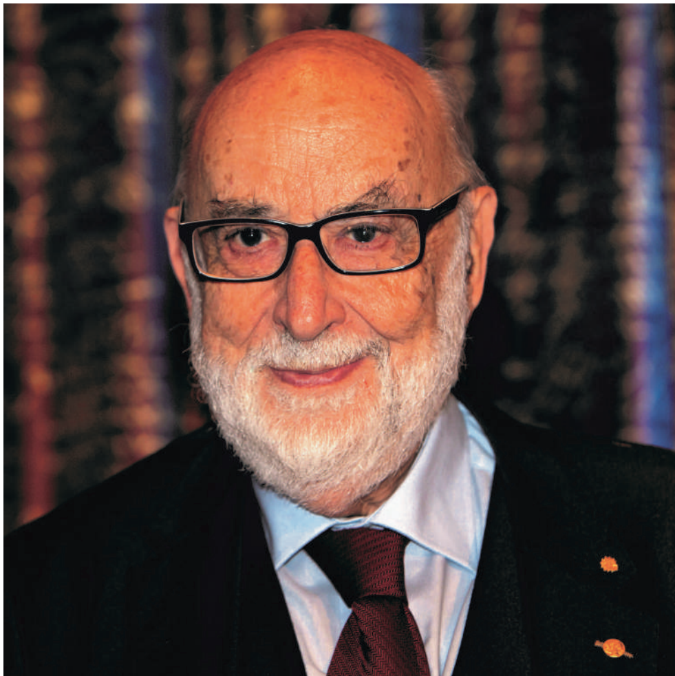
HET ONDERZOEK WIL NIET INSGEHELE EEN INDEKS PRUIS OP LEREN VAN FEDERAAL

De fusie van het Agentschap voor Innovatie door Wetenschap en Technologie met het Agentschap Ondernemen in één overkoepelend Agentschap voor Ondernemen en Innovatie is in dit opzicht emblematisch voor een beleid dat wetenschap vooral wil inschakelen in de bedrijfswereld. Dit “met oog op meer klantvriendelijkheid” en als “tool box waarmee Vlaamse bedrijven en internationale bedrijven die zich in Vlaanderen willen vestigen optimaal ondersteund kunnen worden”, zo stelt de beleidsnota. “Dat past in de ruimere filosofie van het regeerakkoord dat sterk uitgaat van de economische waarde, al wordt ook niet het volledige wetenschapsbeleid ingeschreven in een economische logica”, tempert Sinardet. Kortom: academici blijven zich verzetten tegen een economische en partijpolitieke logica die niet de hunne is, maar of hun grieven gehoor zullen krijgen, blijft een groot vraagteken. Wat dat betreft, zitten we allen in eenzelfde schuitje. ❖